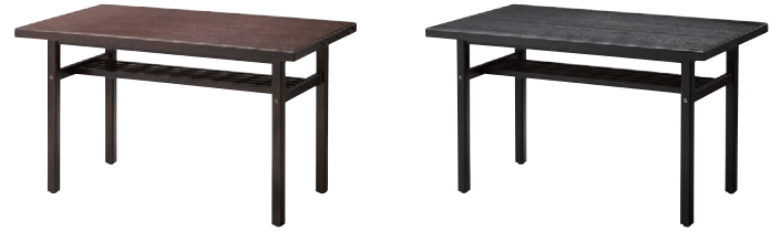
新・加賀テーブル