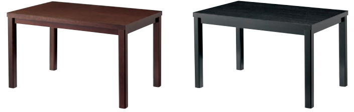
新・大関テーブル