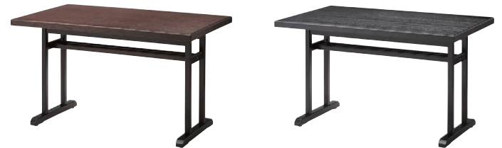
新・松島テーブル